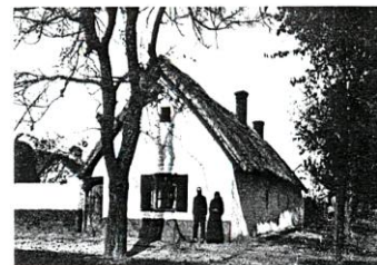
Ansiedlerhaus aus dem Jahre 1785 in Neu-Werlas

Die Hofkammer in Wien genehmigte zwei Formen von Häusern, ein Bauernhaus mit Küche, Stube und Kammer und ein kleineres für die Handwerker, die „ Kleinhäusler “. Erst zur Zeit des dritten großen Schwabenzuges gehörten Vorratskammern und Stallungen zum amtlich vorgesehenen Hausplan.