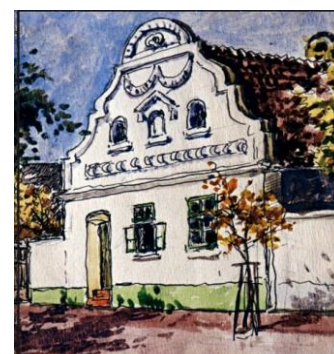
Abb. 20: „Dorfstraße“ des Brestowatzers S. Leicht , „Giebelhaus in Triebswetter“ (S. Jäger ).